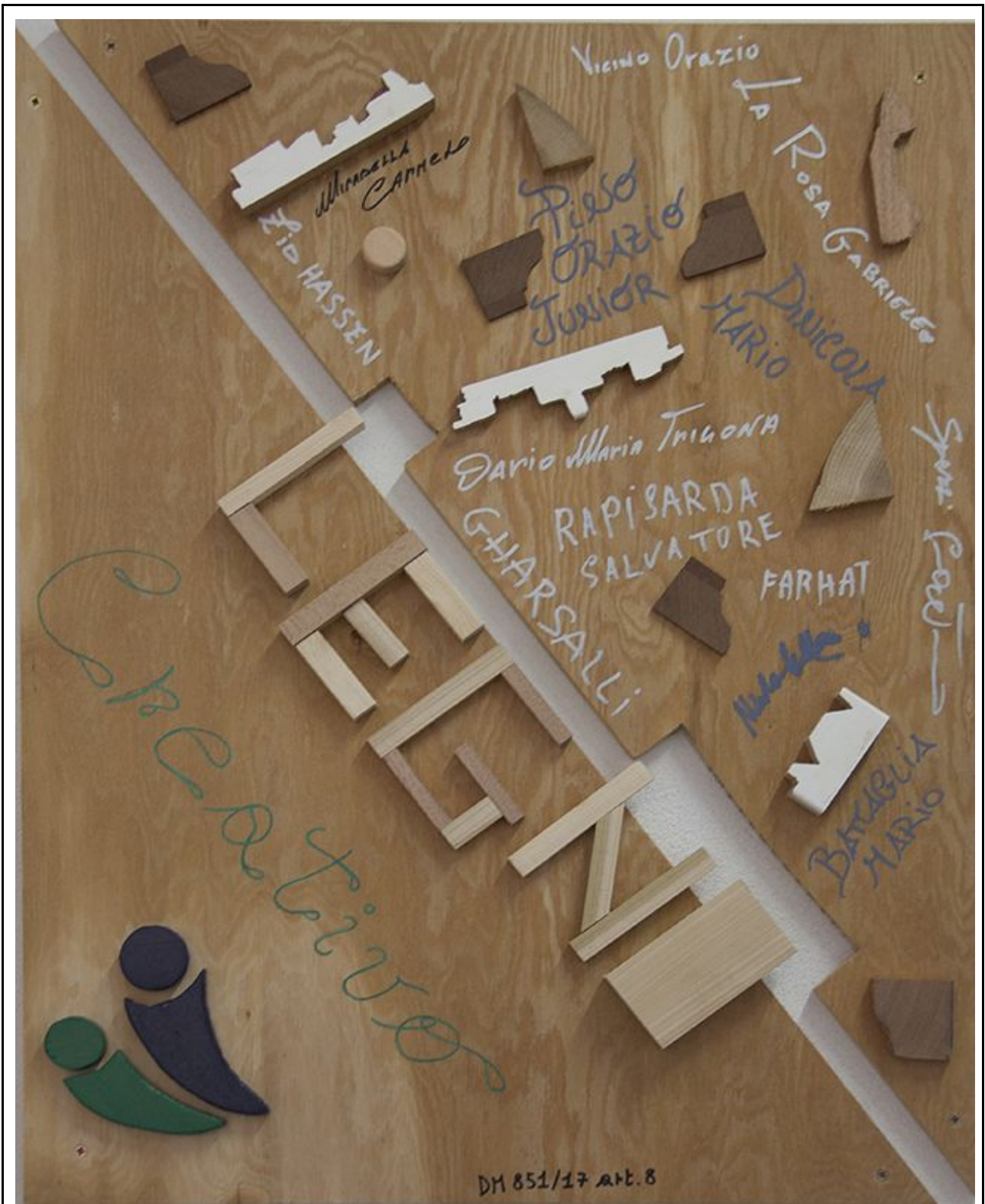
Il pannello con il titolo del progetto