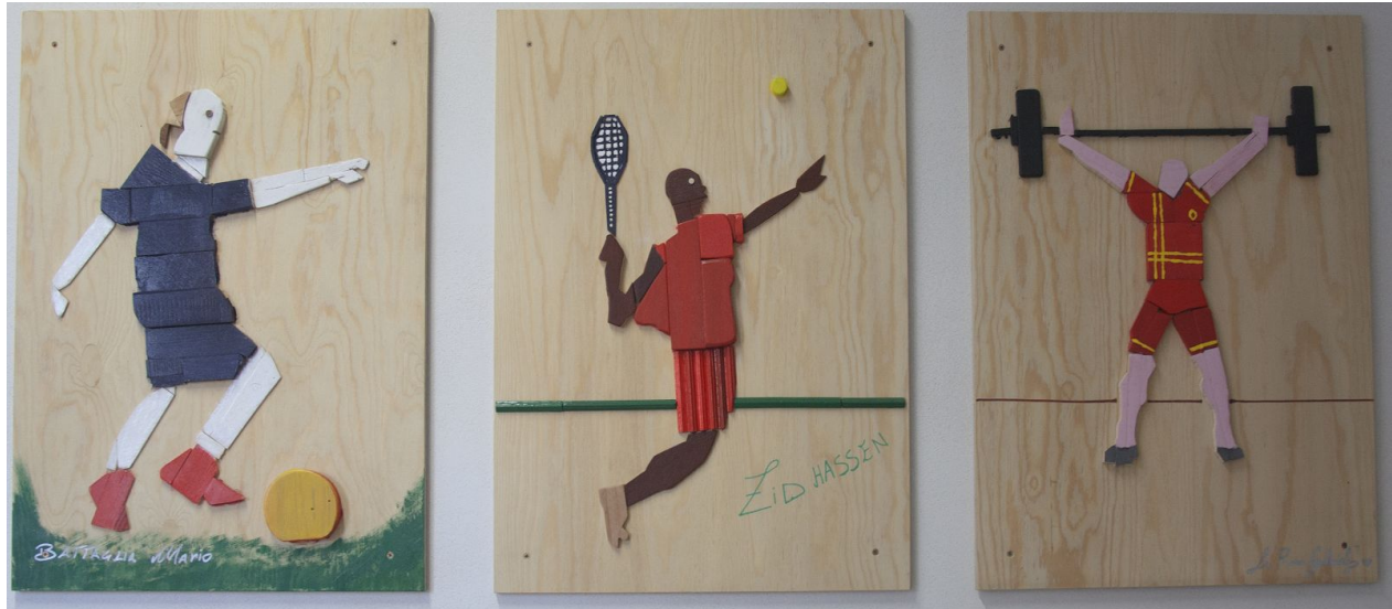
Alcune delle opere realizzate