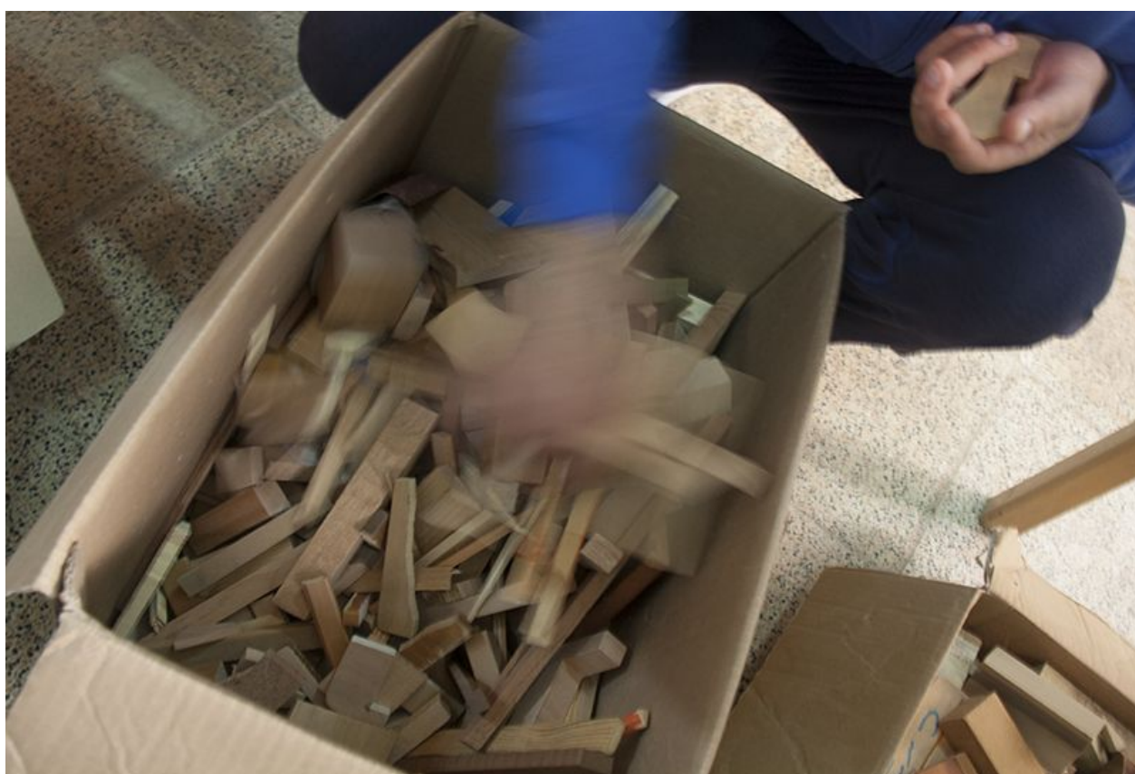
La scelta dei materiali