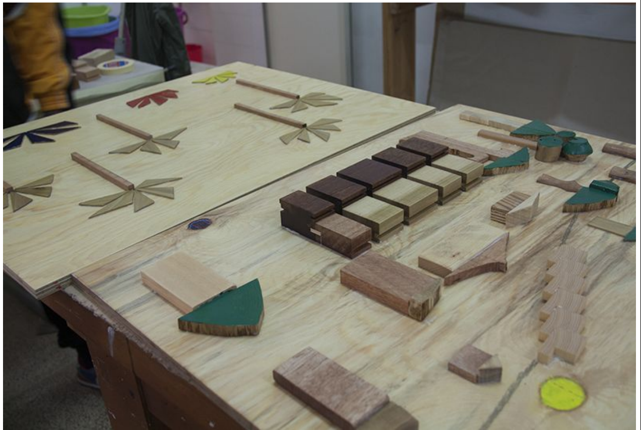
La realizzazione dei lavori